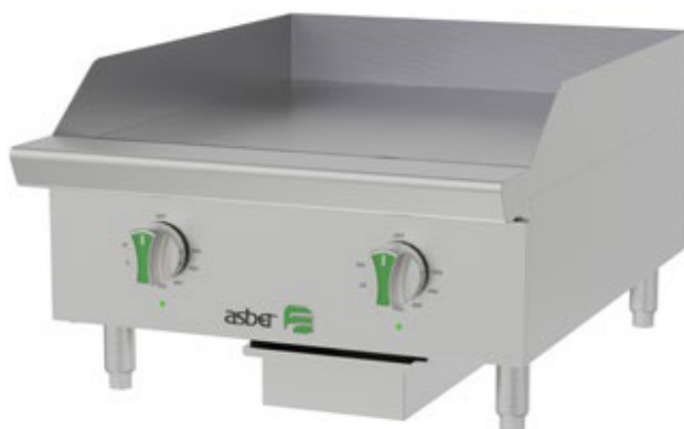
AETG E 24 EM

Consultar al fabricante los datos de potencia y de amperaje.